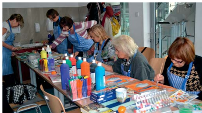
Warsztaty „Lubię poniedziałki” w OKM.

Szczegółowe informacje na temat oferty edukacyjnej znaleźć można na naszej stronie internetowej www.nmm.pl .