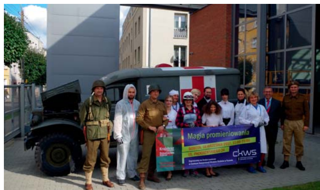
Załoga NMM gotowa do festynu „Magia promieniowania” w CKWS w Tczewie