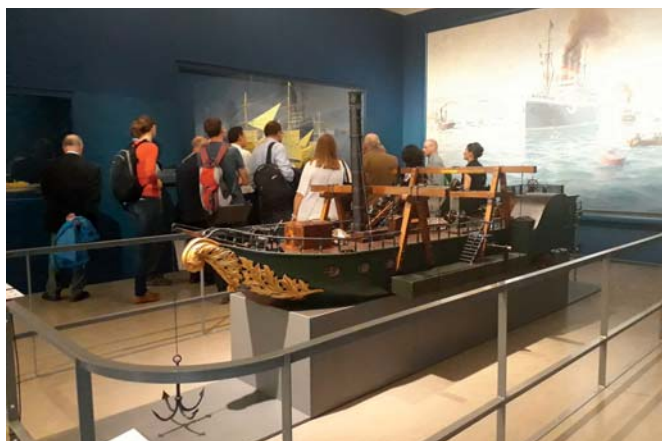
Uczestnicy seminarium w trakcie zwiedzania poświęconego żegludze fragmentu ekspozycji Muzeum Techniki w Wiedniu.