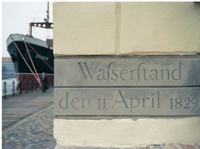
Wodowskaz widoczny od strony przystani promu „Motława”.