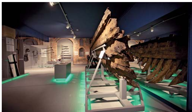
Burta Miedziowca dominuje nad częścią ekspozycji poświęconą bitwie na Zalewie Wiślanym.

W ramach programu edukacyjnego towarzyszącego wystawie zaplanowano dzień otwarty dla publiczności, cykl wykładów oraz specjalne warsztaty i zajęcia dla dzieci i młodzieży.