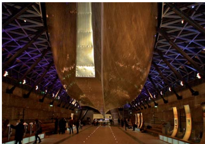
„Cutty Sark” w nowej formule prezentacji: „zawieszony” nad suchym dokiem w londyńskim Greenwich.