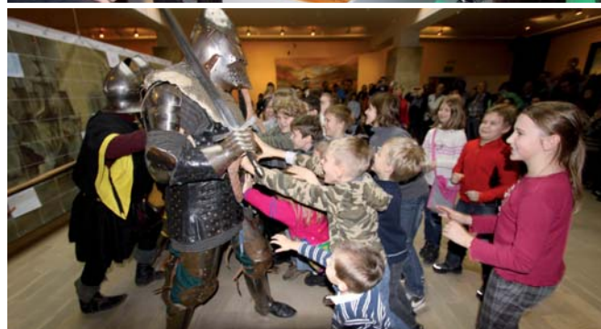
Rodzinne zwiedzanie wystawy „Do abordażu!”.