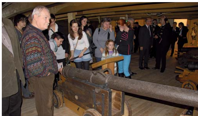
Dużym zainteresowaniem gości wernisażu cieszył się pokład działowy.