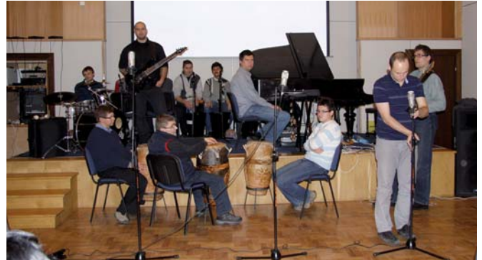
Grupa „A może...” w trakcie koncertu w CMM.

Po wernisażu odbył się koncert grupy niepełnosprawnych muzyków „A może...”, pod kierunkiem trójmiejskiego artysty Tomasza Szwelnika. Koncert zainspirowany został odgłosami morskich fal, rozbijających się o brzeg, krzyku mew, przesypującego się piasku. Grano na perkusji, gitarze elektrycznej, pianinie, afrykańskich bębnach i... wodzie. Wśród muzyków znaleźli się również autorzy prac plastycznych z tegorocznej i wcześniejszych wystaw.