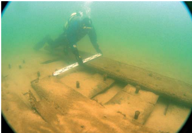
Jednym z nowo odkrytych wraków jest szkuta z początku XVI w.

Na początku listopada zespół archeologiczno-nurkowy CMM wykonał, wspólnie ze specjalistami z Zespołu Pomiarów Morskich Urzędu Morskiego w Gdyni, oględziny kolejnych siedmiu obiektów odkrytych w trakcie sonarowania przedpoła dawnego wejścia do portu gdańskiego. Rezultaty tych prac przeszły najsmielsze oczekiwania. Ich wstępne wyniki wskazują, że natrafiono między innymi na wrak z początków XV wieku, pozostałości dużej jednostki rzecznej z 1. ćw. XVI wieku, szczątki żaglowca z ładunkiem kamieni młyńskich oraz pozostałości falochronu chroniącego wejście do dawnego portu gdańskiego. Odkrycia te – wraz z wcześniej zlokalizowanym wrakiem z XVI wieku z ładunkiem żelaza i miedzianych misek – pokazują, że obecnie ten niewielki rejon stanowi najciekawszy i najbardziej obiecujący obszar przyszłych podwodnych prac archeologicznych.