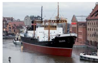
„Sołdek” wraca po remoncie na Motławę.

Przez trzy tygodnie, od 26 października do 19 listopada, nadmotławski krajobraz centrum Gdańska był przedmiotem komentarzy przechodniów, zastanawiających się głośno: „Czemu tu tak pusto?”.