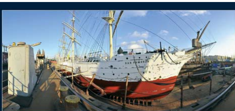
DAR POMORZA w suchym doku Gdańskiej Stoczni „Remontowa” S.A. - listopad 2008r.