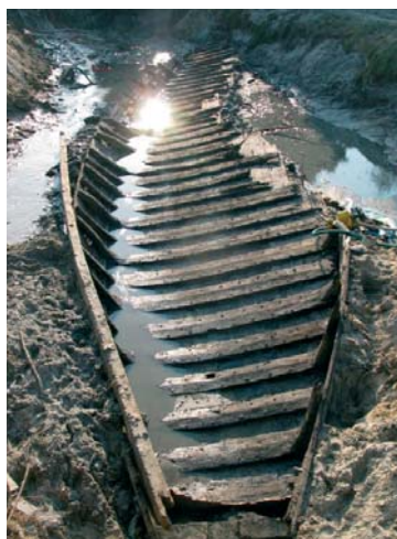
Wrak szkuty w trakcie badań.

We wrześniu ubiegłego roku dr Waldemar Ossowski z Działu Badań Podwodnych CMM przeprowadził w ramach projektu badawczego „Przemiany w szkutnictwie rzeczonym w dorzeczu Odry i Wisły” wstępne oględziny wraka statku rzeczynego, znalezione w starorzeczu Wisły w Czersku (gmina Góra Kalwaria). Dzięki pobranym wówczas próbkom do badań dendrochronologicznych ustalono, że statek zbudowano po 1455 roku. W trakcie tegorocznej ekspedycji, która miała miejsce