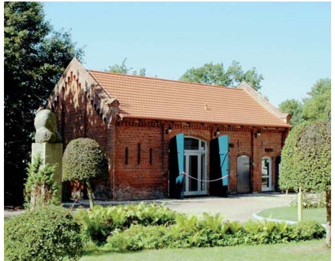
Rozewska Stodoła w oczekiwaniu na gości wernisażu.

CMM, które obsługuje ruch turystyczny w latarni Rozewie, wzbogacił się o kolejny udostępniony do zwiedzania obiekt. Po odnowieniu maszynowni z początku XX wieku, z zabytkową maszyną parową do pracy latarni i buczków przeciwmgłowych oraz wędzarni z piekarnią mieszczącą piec chlebowy, postanowiono wyremontować nieużywaną od lat stodołę i zaadaptować ją na potrzeby wystawienniczo-kulturalne (koncerty, warsztaty artystyczne itp.). Wymieniono konstrukcję dachu i położono nową dachówkę, wykonano izolację murów oraz oczyszczono i pomalowano ściany. Efekt prac zaprezentowano 5 sierpnia, kiedy to w obecności zaproszonych gości, członków Towarzystwa Przyjaciół CMM i licznie przybyłych turystów, budynek uroczystie udostępniono publiczności, inaugurując działalność Sali Wystawowej „Stodoła”. Tego dnia latarnię przyozdobiono flagami morskiego kodu sygnałowego, a na wyremontowanym budynku zawieszono symboliczną wstęgę, którą przecięli: prof. Witold Andruszkiewicz, podsekretarz stanu Ministerstwa Infrastruktury Anna Wypych-Namietko, szef służby cywilnej Kancelarii Prezesa RM Sławomir Brodziński, wicedyrektor CMM Maria Dyrka, prezes TP CMM Fryderyk Tomala, burmistrz Władysławowa Grażyna Cern, poseł na Sejm RP Jan Kulas, starosta pucki Wojciech Dettlaff i dyrektor Urzędu Morskiego w Gdyni Andrzej Królikowski. Pierwszą wystawą prezentowaną w nowym wnętrzu była ekspozycja akwareli Michała Adamczyka, o tematyce marynistycznej, zorganizowana przez Galerię Klucznik z Gdańska.