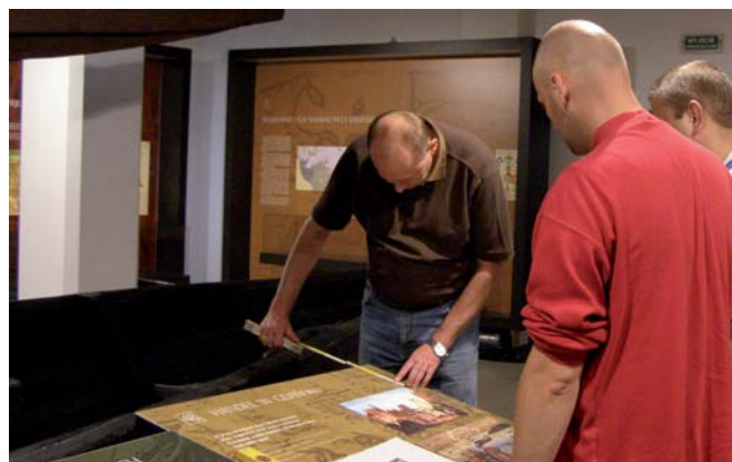
Prace nad wystawą w Muzeum Wisły.

Nie ustają prace nad pierwszą częścią nowej ekspozycji stałej w Muzeum Wisły w Tczewie – „Wisła w dziejach Polski”. Wykonano i umocowano niemal wszystkie reprodukcje ilustracji, część zabytków umieszczono w gablotach, oszkolono i uruchomiono wszystkie makiety, zdecydowano o ostatecznym rozmieszczeniu łodzi, przygotowano projekty banerów informacyjnych z tytułami poszczególnych stanowisk. Ponadto redagowano podpisy do ilustracji oraz przygotowano scenariusze prezentacji multimedialnych. W pracach tych uczestniczyły spore grono pracowników CMM, zarówno z pionu administracyjnego, jak i merytorycznego, którzy – oprócz wkładu pracy – przyczyniają się do powstania ekspozycji swoją pomysłowością i zaangażowaniem. Realizację wystawy bardzo ułatwiło przyznanie przez Ministerstwo Kultury i Dziedzictwa Narodowego specjalnej dotacji, z której zostanie sfinansowany m.in. zakup sprzętu elektronicznego.