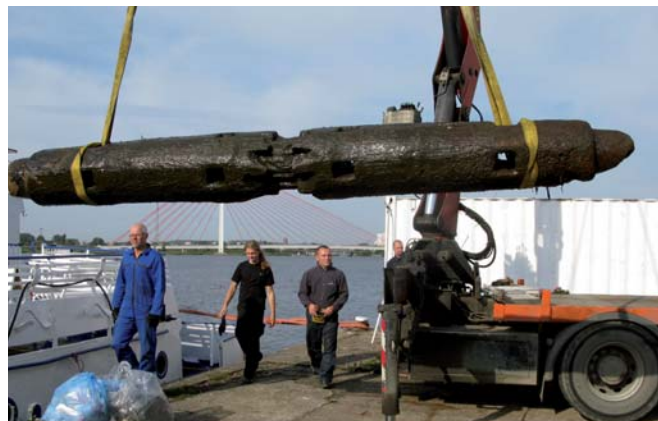
Wydobyty element windy kotwicznej.