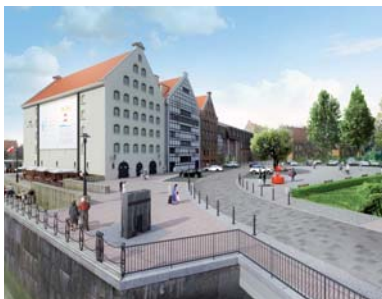
Wizualizacja ul. Ołowianka po zrealizowaniu projektu – z dokumentacji Zarządu Dróg i Zieleni w Gdańsku

W sierpniu rozpoczęła się realizacja inwestycji Zarządu Dróg i Zieleni w Gdańsku – rozbudowa ul. Ołowianka w bezpośrednim sąsiedztwie głównej siedziby CMM. Projekt zakłada wykonanie nowej nawierzchni jezdni i miejsc postojowych, ułożenie chodnika oraz wyłożenie kostką granitową placu w kierunku kanału Na Stępcie. Planuje się również wykonanie nowej kanalizacji deszczowej oraz oświetlenia ulicznego. Zadanie przewiduje budowę pochylni umożliwiającej dostęp do nabrzeża osobom niepełnosprawnym. Prace potrwają do maja przyszłego roku.