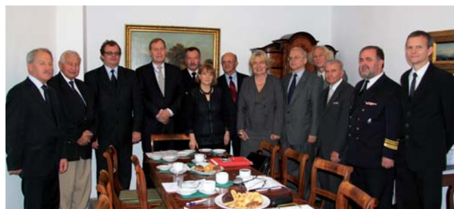
Rada Muzeum na lata 2011-2015 w trakcie pierwszego spotkania z dyrekcją CMM.