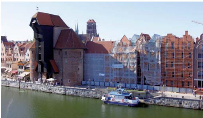
OKM – stan na 30 września.

Budowa Ośrodka Kultury Morskiej zbliża się do końca. Wnętrza budynku przybierają swój ostateczny wygląd – trwa układanie posadzek kamiennych oraz podłóg drewnianych, a w pomieszczeniach technicznych kładziona jest żywica epoksydowa. Montowane są windy oraz kładki stanowiące element klatki schodowej znajdującej się w holu głównym budynku. Szybko posuwają się prace związane z okładziną elewacyjną – warto przy tym dodać, że zastosowana przez wykonawcę cegła zbiera pochwały. Jednocześnie z pracami wykończeniowymi w budynku trwają działania związane z aranżacją i wyposażeniem wnętrza. Laboratoria Działu Konserwacji Muzealiów zostały już wyposażone w specjalistyczne meble oraz odpowiednią aparaturę naukowo-badawczą, która będzie wykorzystana w prowadzeniu procesów konserwatorskich, przygotowany jest też montaż liofilizatora (urządzenia do konserwacji zabytków metodą wymrażania). Dział Edukacji intensywnie współpracuje z firmą Mega z Oleśnicy przy realizacji wystawy interaktywnej. Zaawansowane są również prace związane z drugą stałą wystawą – „Łodzie ludów świata”.