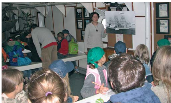
Zajęcia „Poznajemy statek” na pokładzie „Daru Pomorza”.