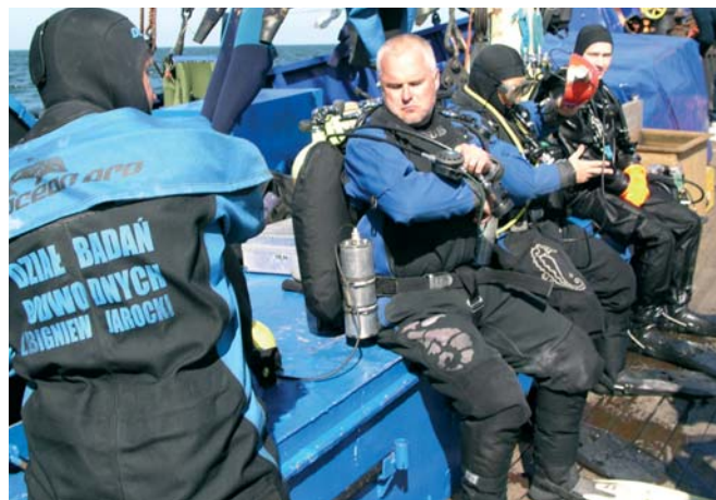
„Kaszubski Brzeg” jeszcze jako baza archeologów i płetwonurków Działu Badań Podwodnych CMM.

zapewne niedługo zniknie sprzed Spichlerzy na Ołowiance, gdzie cumował pomiędzy kolejnymi wyprawami. Statek został wystawiony na sprzedaż, a dyrekcja CMM ma nadzieję, że znajdzie się nabywca, który będzie nadal eksploatował tę zasłużoną jednostkę. Zbudowany w latach 1954-55 w Stoczni Północnej w Gdańsku, do 1983 roku służył jako okręt awaryjno-ratowniczy Marynarki Wojennej R-22, po czym przekazany został CMM.