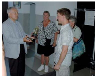
Model soczewki Fresnela, dar sympatyków latarnictwa z USA, znajduje się na ekspozycji w Rozewiu.