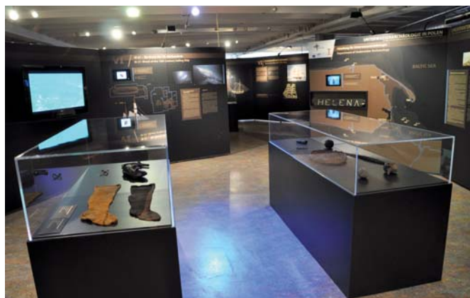
Polska część wystawy „1 morze – 4 opowieści”, przygotowanej w ramach projektu Seaside.