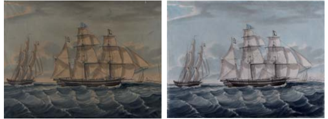
Portret barku „Poniatowski” przed i po konserwacji.