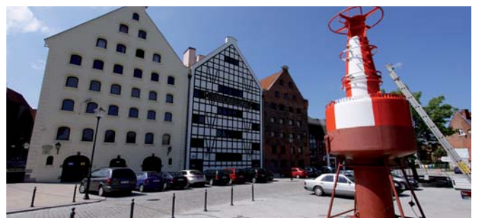
Po uporządkowaniu placu Spichlerze na Ołowiance od strony kanału Na Stępcie prezentują się równie atrakcyjnie, jak od strony Motławy.

Zakończona została realizowana przez Zarząd Dróg i Zieleni w Gdańsku przebudowa ul. Ołowianka między główną siedzibą CMM w Spichlerzach na Ołowiance a kanałem Na Stępcie. Powstał estetyczny plac wyłożony kostką granitową, z ławkami zachęcającymi do odpoczynku w cieniu drzewa i miejscami parkingowymi w ilości zaspokajającej potrzeby gości i pracowników Muzeum. Elementem podkreślającym specyfikę miejsca jest pława bezpieczeństwa, przekazana przez Urząd Morski w Gdyni.