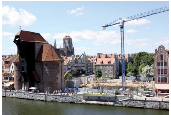
Stan prac przy wznoszeniu OKM na koniec czerwca.

Najbardziej widoczną zmianą na budowie Ośrodka Kultury Morskiej przy gdańskim Żurawiu jest wprowadzenie żurawia wieżowego, jednak zakres wykonanych w czerwcu prac jest znacznie szerszy. Zakończono już budowę fundamentów, stawiane też są ściany żelbetowe w niepodpiwniczonej części budynku.