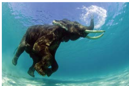
Nurkujący słon indyjski.