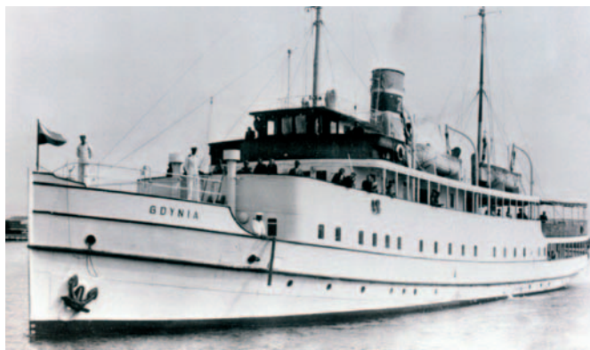
Jedna z jednostek z Gdynią w nazwie: statek przybrzeżnej żeglugi pasażerskiej sprzed 1939 r.