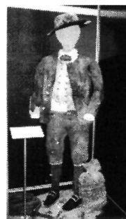
Zrekonstruowane ubranie marynarskie z XVIII wieku z wraka General Carleton

18 czerwca zostanie udostępniona dla zwiedzających pokonkursowa „Wystawa modeli kartonowych, plastikowych, miniaturowych i dioram morskich statków i okrętów”.