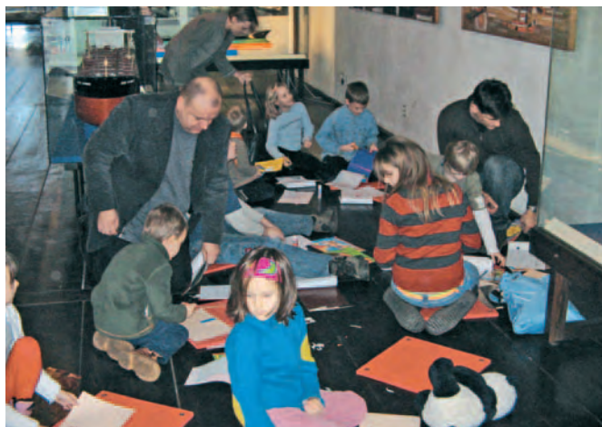
I dzieci, i dorośli świetnie się bawili, poznając „Historie pędzlem malowane”.

Trzecie spotkanie w ramach nowego programu edukacyjnego CMM, przeznaczonego dla rodzin z dziećmi w wieku 7-13 lat, odbyło się 14 stycznia pod hasłem „Historie pędzlem malowane”. Pomimo wyjątkowo niesprzyjającej pogody do Spichlerzy na Ołowiance stawiło się ponad 30 rodzin (ok. 100 osób), co potwierdziło potrzebę organizacji tego rodzaju zajęć, a także ich wysoką ocenę przez dotychczasowych uczestników. Tym razem wspólnie wykonywano zadania w oparciu o kolekcję obrazów ekspozycyjnych na wystawie „Polacy na morzach świata”, próbowano sił w malarstwie portretowym, a nawet w magicznej sztuce malowania niewidzialnymi farbami.