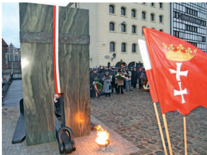
Uroczystość odsłonięcia pomnika „Tym, którzy nie powrócili z morza” przed Spichlerzami CMM na Ołowiance. Na odwrocie pomnika motto ludzi morza: „Navigare necesse est”.