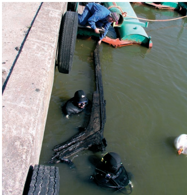
Prace na wraku średniowiecznego statku w porcie rybackim w Rowach: moment wydobywania węzłówki łączącej dziobnicę ze stępką

Ekspedycje Działu Badań Podwodnych CMM tradycyjnie wywołują wiele emocji i są najczęściej opisywaną przez media dziedziną działalności naszego muzeum. Sezon 2004 przyniósł kilka spektakularnych sukcesów. Wiosną kontynuowano prace na wraku E35.1 – drewnianego statku odkrytego w czasie pogłębiania kanału portowego w Rowach. Pozyskano ponad 60 zabytków, a wśród nich elementy konstrukcyjne wskazujące, że był to średniowieczny statek typu koga.