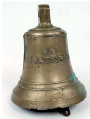
Dzwon z m.s. „Batory”.