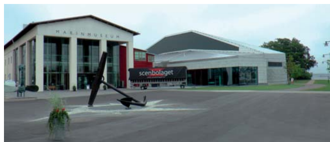
Po prawej – nowy, imponujący budynek ekspozycyjny dla okrętów podwodnych w Marinmuseum w Karlskronie.